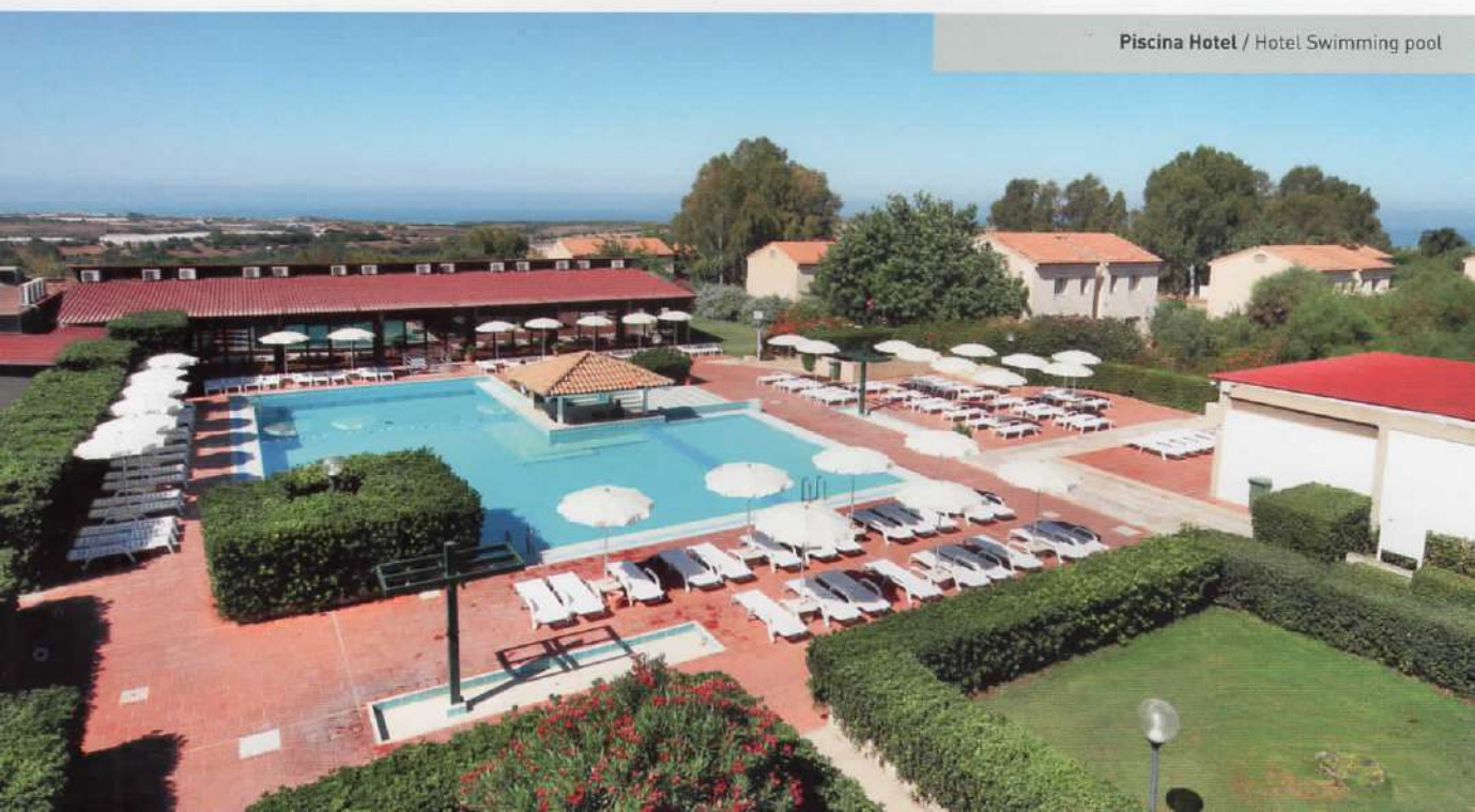
Piscina Hotel / Hotel Swimming pool