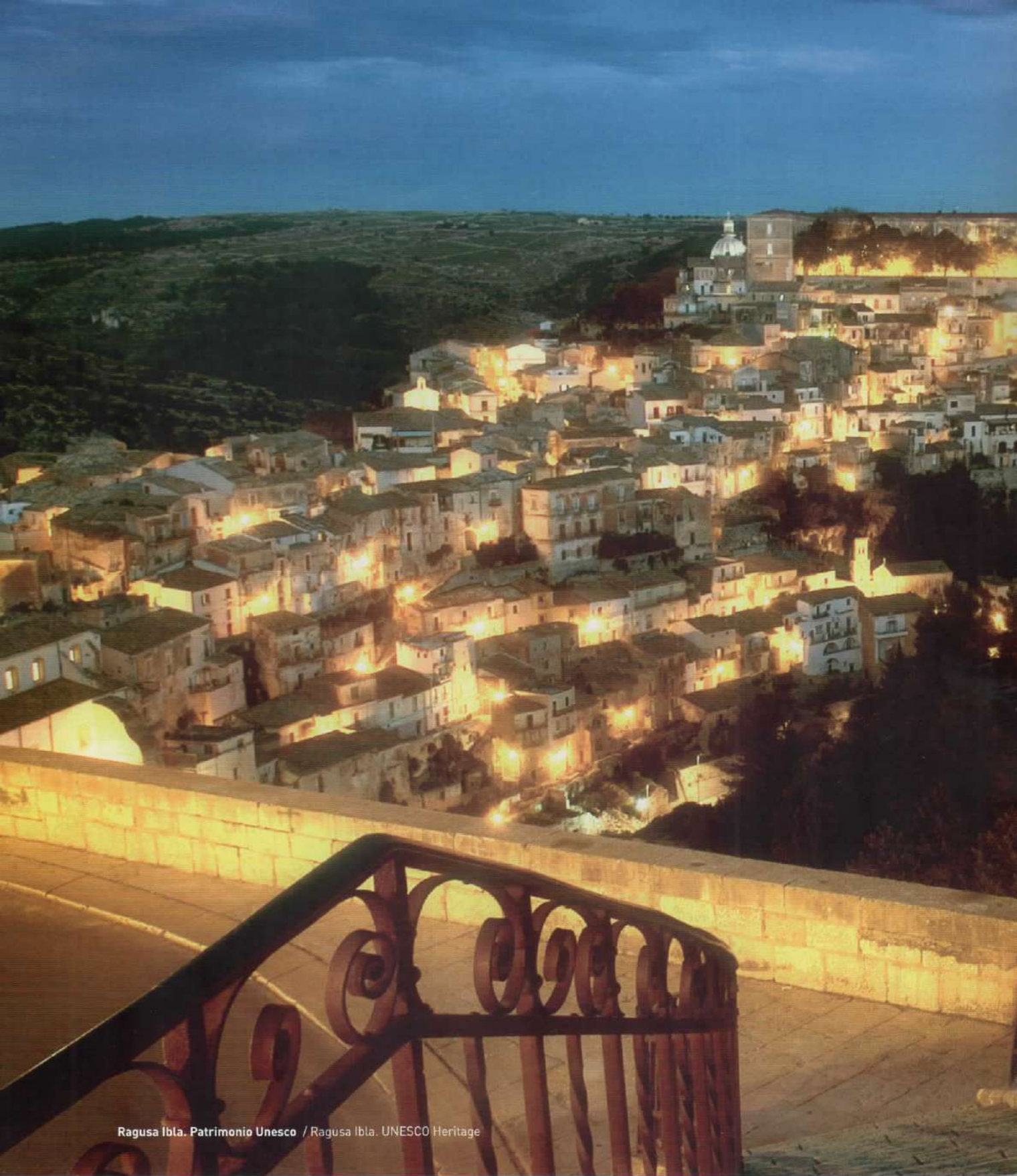
Ragusa Ibla. Patrimonio Unesco / Ragusa Ibla. UNESCO Heritage