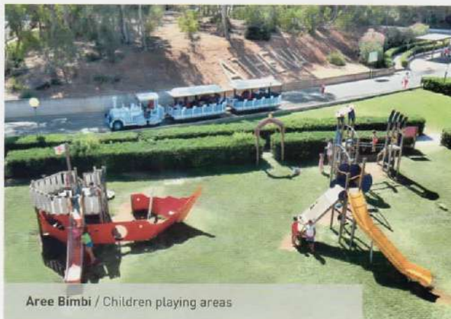
Aree Bimbi / Children playing areas

Athena Resort dispone inoltre di 8 campi da tennis illuminati in notturna, 4 campi di bocce, tiro con l'arco, campo basket, campo volley, minigolf, canoe, pedalò, noleggio auto, parking non custodito all'interno del complesso, 2 parchi giochi per i bambini, Mini Club con piscina e ampi locali dedicati, Baby Club e Junior Club, con assistenza e animazione riservata a pranzo e cena per intrattenere al meglio i piccoli ospiti. All'interno del caseggiato storico è conservata una piccola cappella per la celebrazione della messa domenicale, per tutto il periodo estivo.