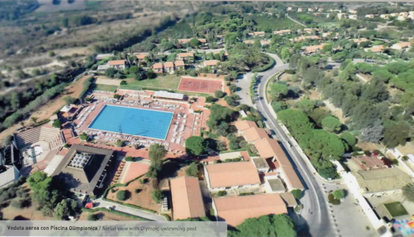
Veduta aerea con Piscina Olimpionica / Aerial view with Olympic swimming pool