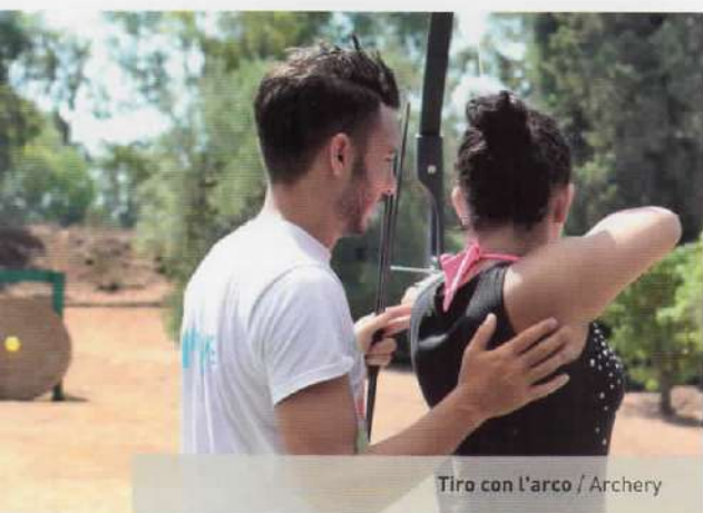
Tiro con l'arco / Archery