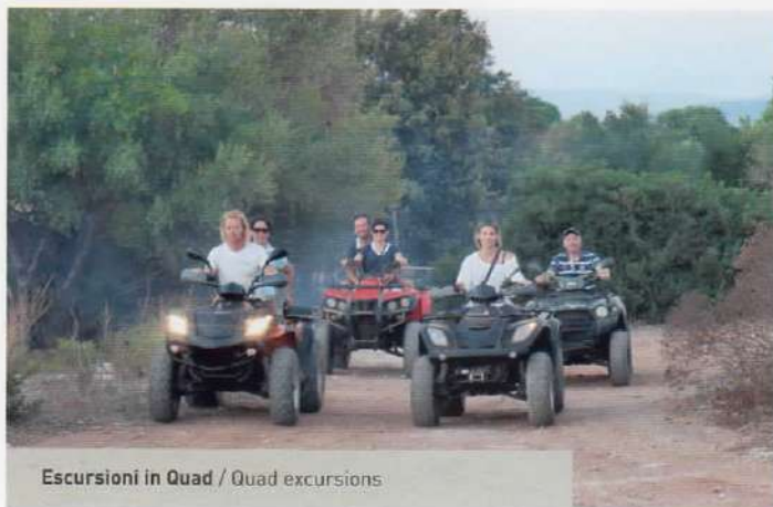
Escursioni in Quad / Quad excursions