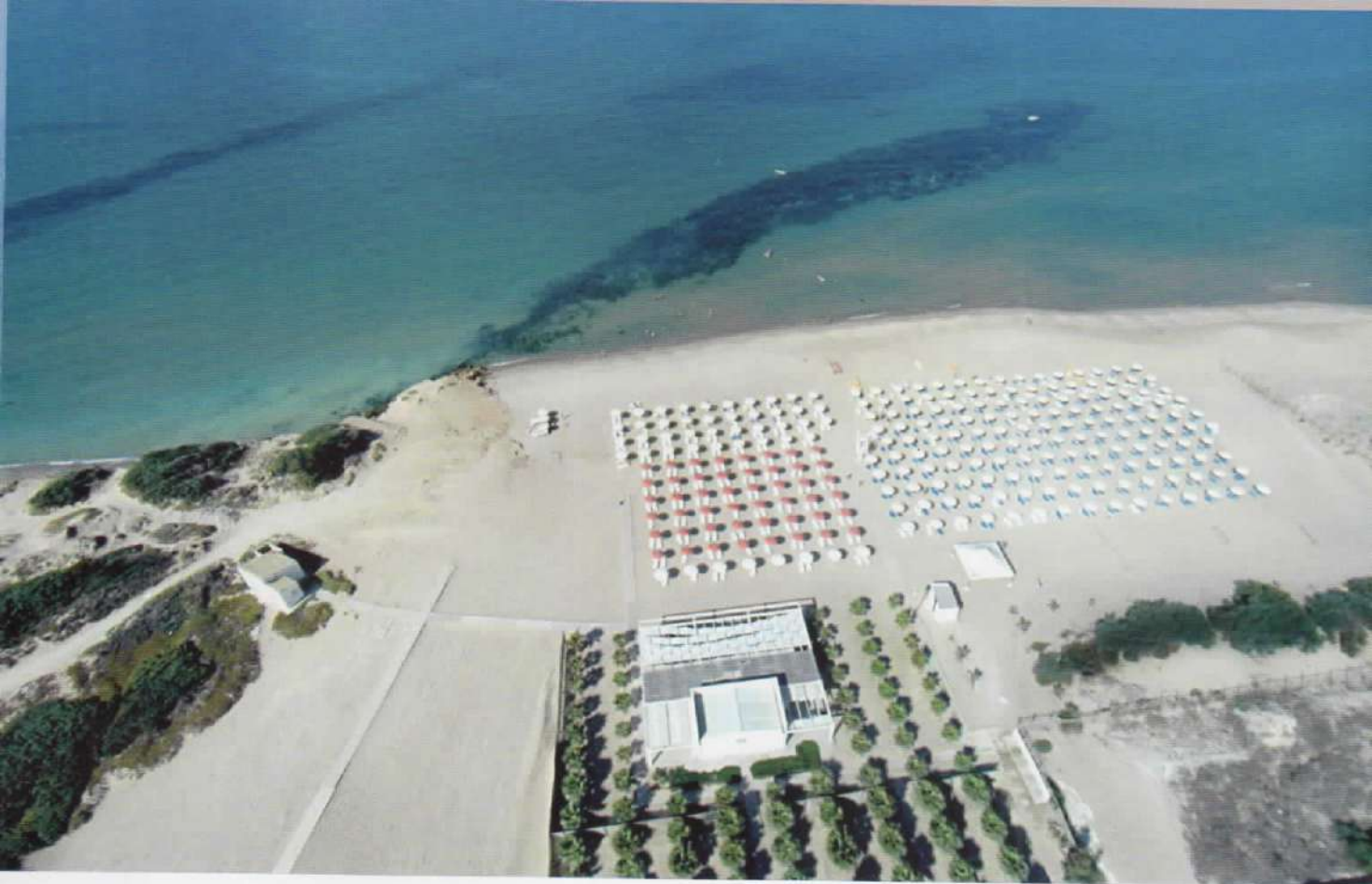
Spiaggia privata Athena Resort / Athena Resort Private beach