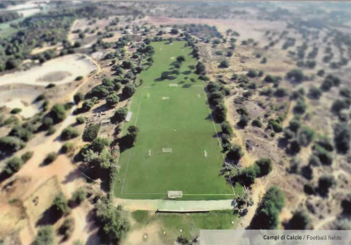
Campi di Calcio / Football fields