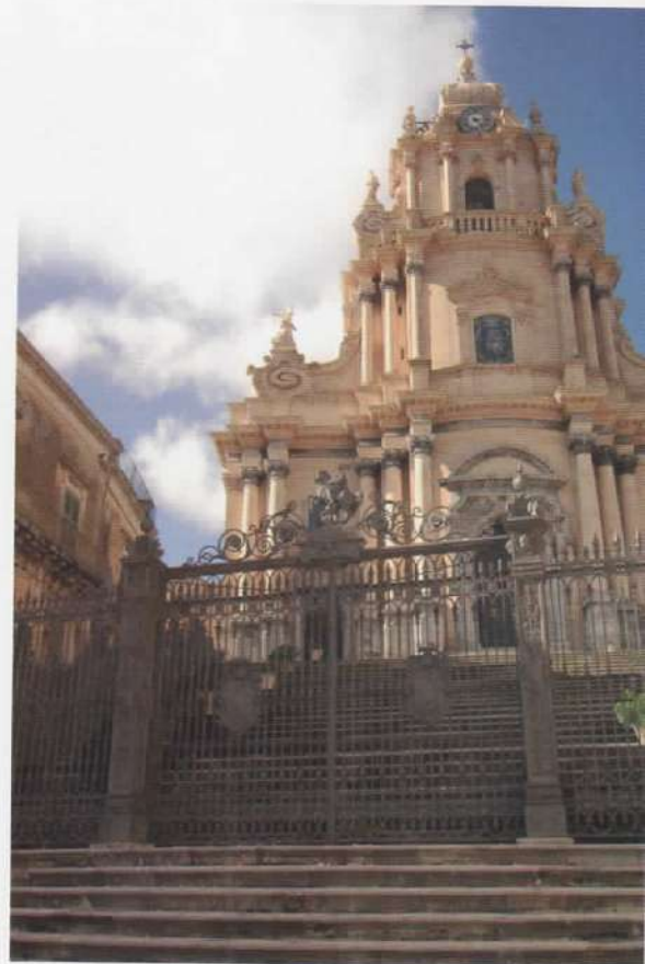
Duomo San Giorgio - Ragusa Ibla / San Giorgio's Cathedral- Ragusa Ibla