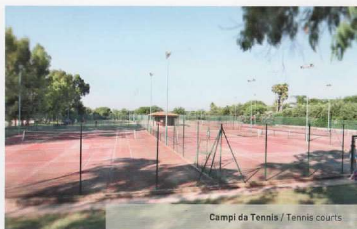
Campi da Tennis / Tennis courts